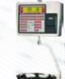
K-350 COLGANTE INOX