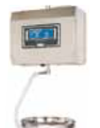
LADO COMPRADOR CON DISPLAY LCD