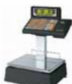
L-850 DOBLE CUERPO