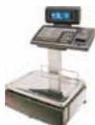
M-520 DOBLE CUERPO