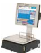
CS-1000 DOBLE CUERPO