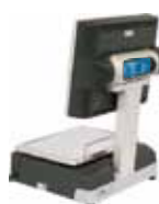
LADO COMPRADOR CON DISPLAY LCD