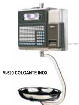
M-520 COLGANTE INOX