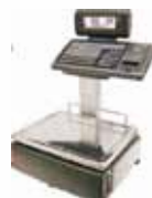
S-547 DOBLE CUERPO