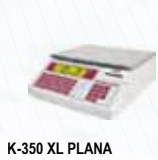
K-350 XL PLANA