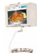
LADO COMPRADOR CON DISPLAY TFT