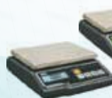
G-300 SOLO PESO