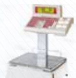
K-355 DOBLE CUERPO