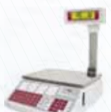
K-355 XL TORRE